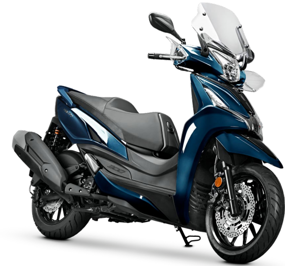
BLU PETROLIO CG411