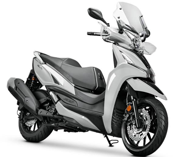
GRIGIO DOSSENA CN713