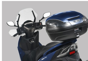
BAULETTO 47 LITRI IN TINTA