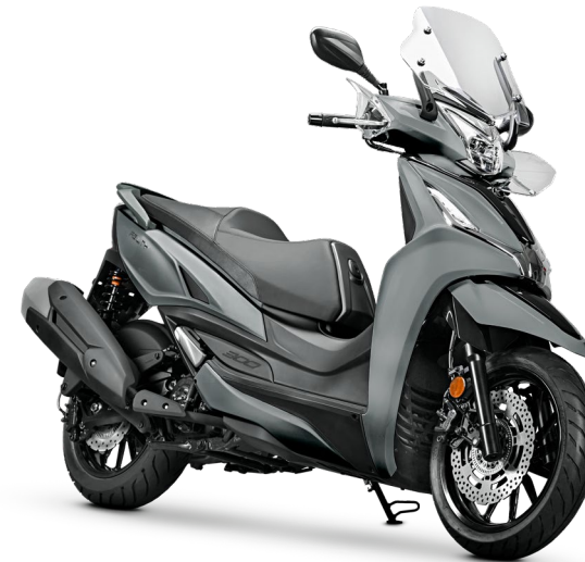
ANTRACITE SCAIS OPACO NH263